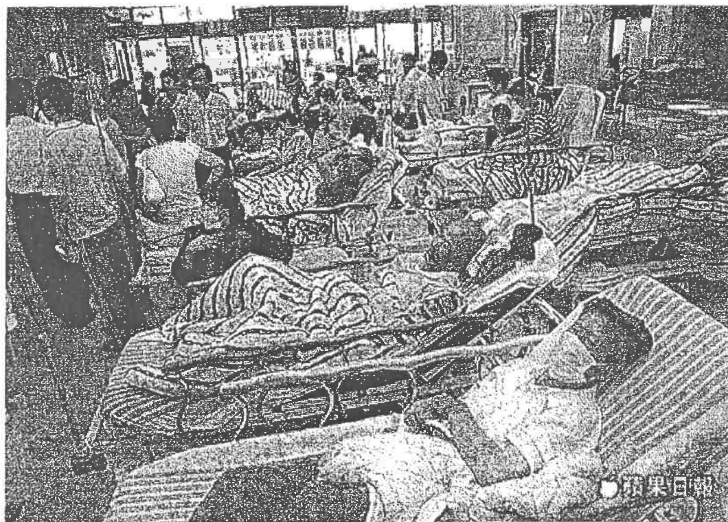
立法院今三讀通過《醫療法》第 82 條修正草案，醫界、民團態度兩極。資料照片